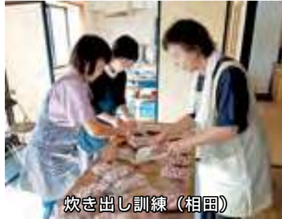
炊き出し訓練 (相田)

▶ 8月31日 総合防災訓練が全地区で行われました。この訓練を基に周辺の危険箇所の確認、身の回りの安全確認をお願いします。