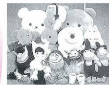
いろいろな絵本の登場人物たち

今年の夏休はグアムへ海外研修にか せてもらいました。四日五日の旅で、その うち二日はホームステイをしました。また、 企業見学 学校交流 観光の内容も充実した ものになりました。それらのことから私学 んだり、感じたりしたことをお話しします。