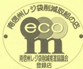
レジ袋削減取組の店ステッカー