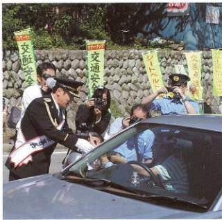
▲ 9月24日 俳優でタレントの峰竜太さんが一日警察署長に委嘱され、交通安全・振り込め詐欺防止の街頭啓発活動を行いました。