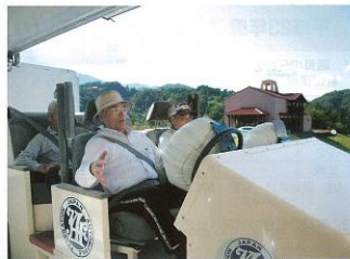
▲ 9月28日 高齢者交通安全教室が行われ、阿南署交通課長の講話、シートベルト体験車・歩行横断トレーナーの体験を行いました。