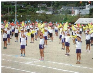
▲ 10月1日 小学校運動会が秋晴れのもと開催されました。児童の皆さんは元気いっぱい競技をしていました。