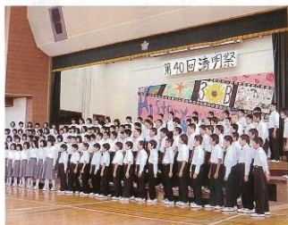
▲ 9月23日～24日 History 一咲かそう思いの華一をテーマに中学校の第39回清明祭が開催されました。峰竜太さんの講演もあり盛大な清明祭となりました。