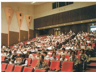
▲ 9月8日 敬老記念行事がコスモホールで開催され、小学生の作文の朗読、歌謡・舞踊ショー、舞踊クラブの余興が催され、約210人の長寿を祝いました。