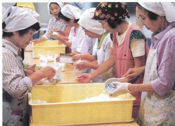
▲ 9月14日 日赤奉仕団約30名による炊き出し訓練がいきいきらんど下條で行われました。