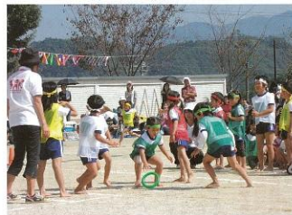
▲ 10月9日 保育所運動会が開催されました。園児のかわいくて、元気いっぱいの姿に会場は和やかな雰囲気となりました。