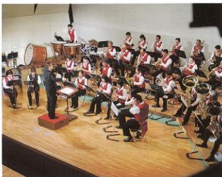
▲ 9月10日 下條村民吹奏楽団の第17回定期演奏会がコスモホールで開催されました。例年のごとく盛大なコンサートとなりました。