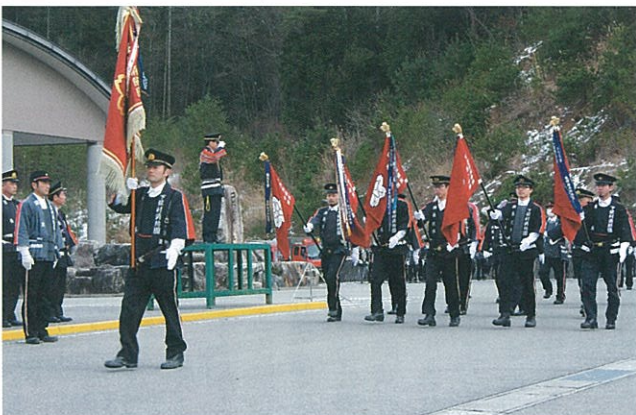
▲ 1月6日 消防団の出初式がコスモホールを会場に開催されました。当日は閲団、分列式、出初式が盛大に行われました。