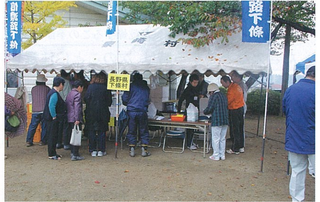
▲ 10月28日 福島県泉崎村で開催された「産業収穫祭」に下條村の特産品のりんごやヨーグルトなどを販売し、大盛況でした。