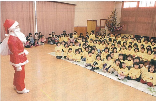
▲ 12月14日 子どもたちはサンタクロースからクリスマスプレゼントをもらいました。