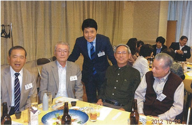
▲ 10月28日 首都圏下條会が東京都新宿区のサンパークで峰竜太さんも駆けつけ、盛大に開催されました。村から出席した理事者、議員を含め約80名の参加をいただきました。