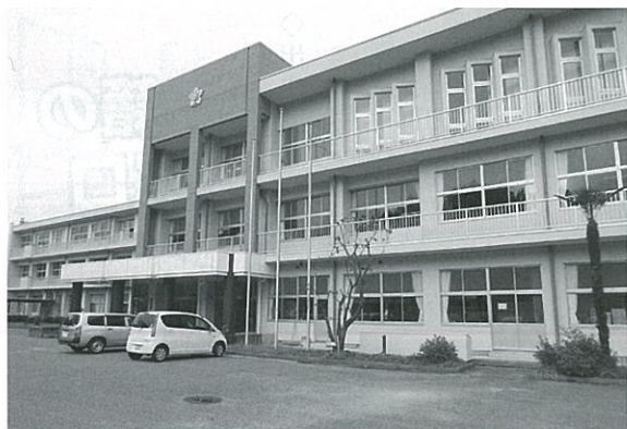
外壁もきれいになりました

主な工事の内容は、外壁工事、外壁タイル改修工事、トイレ洋式化工事、教室掲示壁工事等です。特にトイレは、湿式、和式トイレで、生徒さんからも不評であったため、今回、乾式、洋式トイレに全面改修しました。また、多目的トイレも各階に設置しました。最新式の機能を持ったトイレの改修に「まるでホテルのようなトイレになった」と好評です。廊下や教