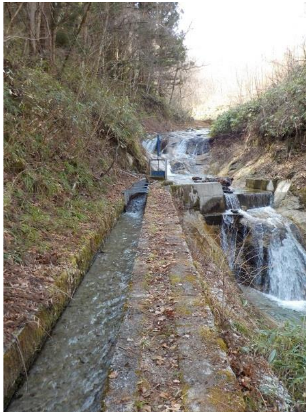
( H30.4.1 新沓川三ツ瀨取水口付近 )