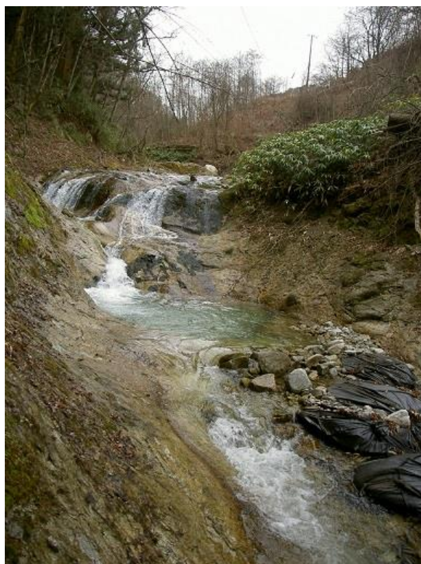
( H28.4.3 新沓川三ツ淵取水口付近 )