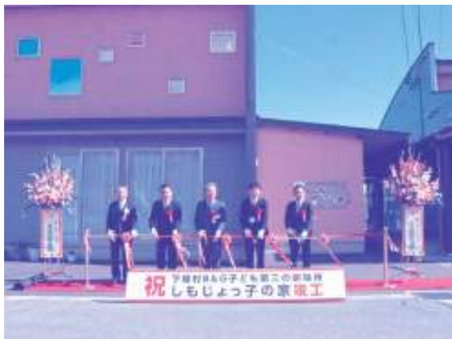
しもじょっ子の家開所式