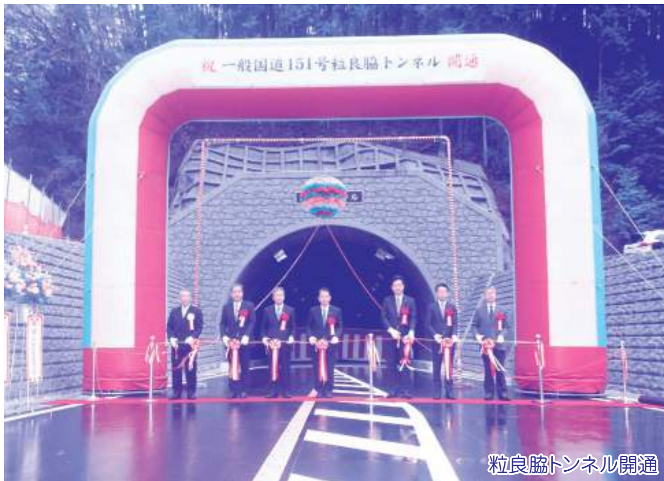
粒良脇トンネル開通