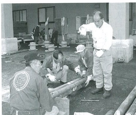
真剣に門松作りに取り組む会員