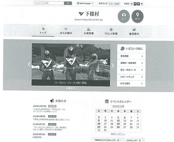
新しくなったトップページ