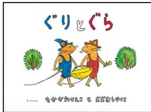
「ぐりとぐら」福音館書店*シリーズ絵本Eオ 3歳~