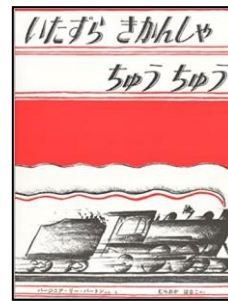
「いたずらきかんしゃちゅうちゅう」福音館書店*シリーズ絵本Eマ 4歳~