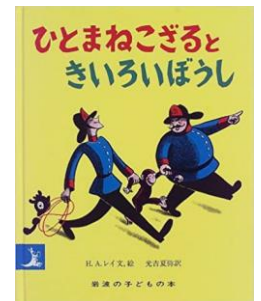
「ひとまねこぎるとときいろいぼうし」岩波書店*シリーズ絵本Eレ 4歳~