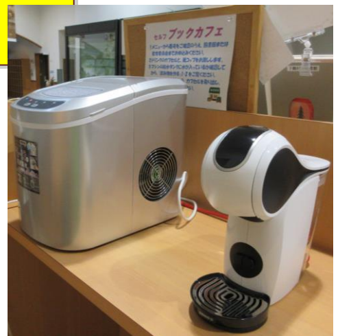
右がドリンクをつくるマシン(ドルチェグスト)。左が製氷機。アイスコーヒーなども作れます(*^^)v

使い方は、マニュアルがありますのでご覧ください。わからない場合は、職員までお声がけください。