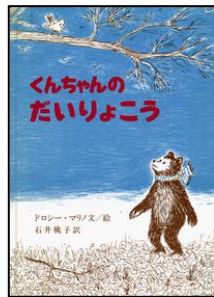
「くんちゃんのだいらよこ」岩波書店*外国の絵本Eマ 4歳~